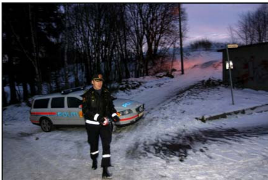
SKUTT: Jenta ble funnet ved denne fotballbanen i et villastrøk utenfor Hommersåk.

HOMMERSÅK/OSLO(VG Nett) En 16 år gammel jente er skutt og drept i Hommersåk utenfor Sandnes. En 17-årig gutt er pågrepet.